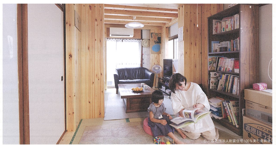
「らくらくハウス」の内観

「らくらくハウス」の地域共生のいえ憲章*3には「自分たちの問題をご近所で助け合って解決していく」と、ある。自立と孤立の境界が曖