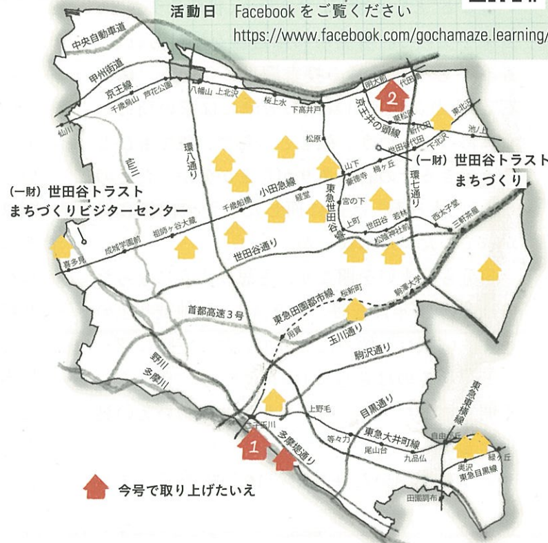
今号で取り上げたいえ